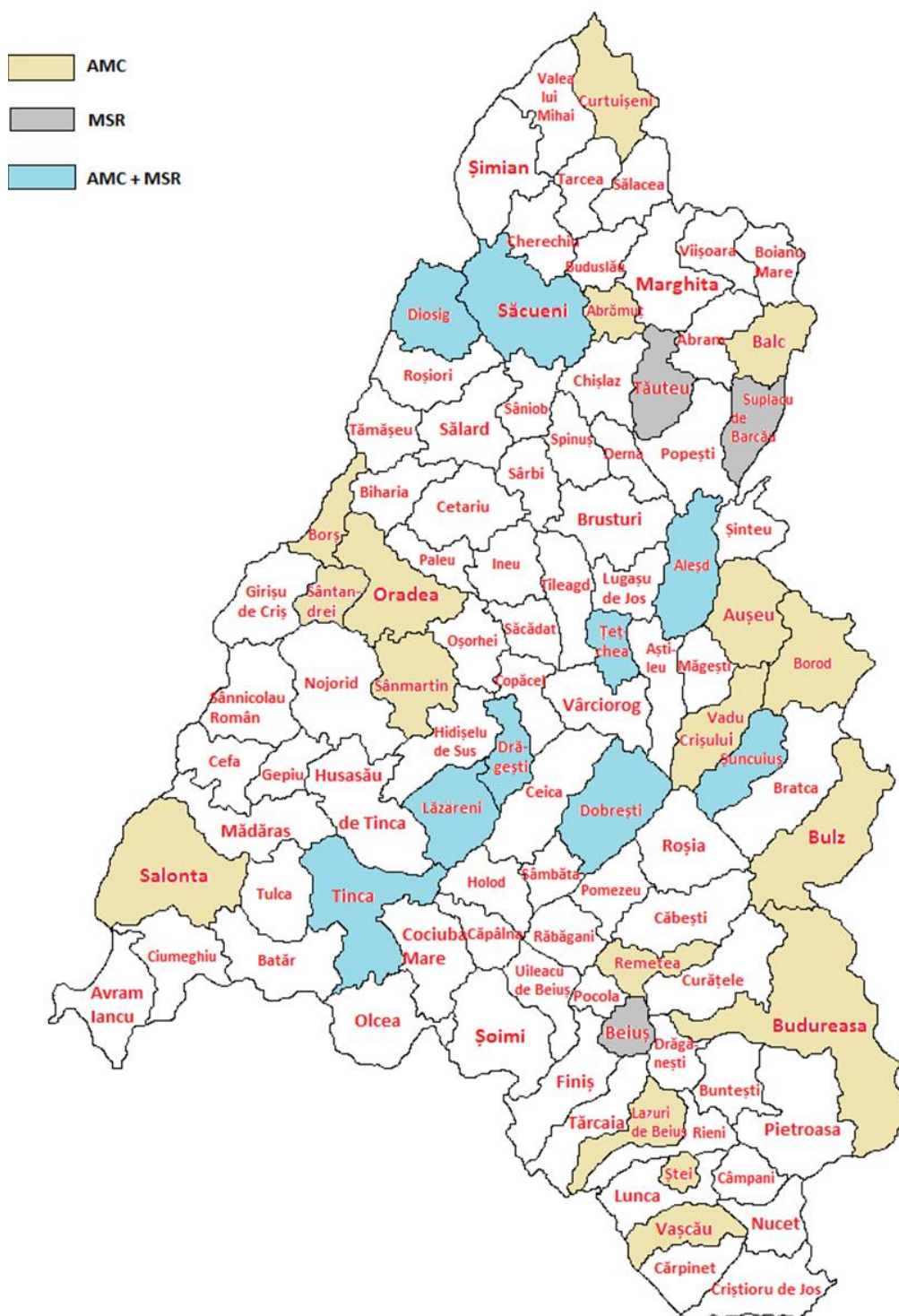
FIGURA 1. HARTA ACOPERIRII CU SERVICII DE ASISTENȚĂ MEDICALĂ COMUNITARĂ (ASISTENT MEDICAL COMUNITAR ȘI / SAU MEDIATOR SANITAR) ÎN JUDEȚUL BIHOR LA NIVELUL ANULUI 2023